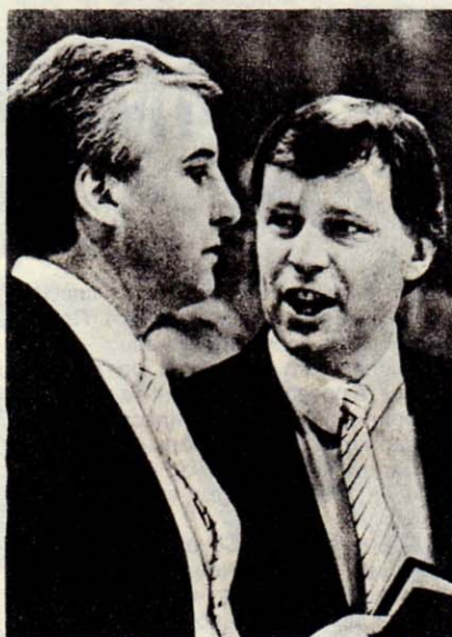
Старший тренер новых чемпионов мира Конни Эвенссон (он — справа) и его помощник Курт Лундмарк

С этим можно было бы согласиться, отпарировала «Турун саномат», если бы среди этих матчей не было ни одного с участием сборной Финляндии. В Турку бы матчи нашей команды собрали больше зрителей, чем в Хельсинки, да и результат, возможно, был бы лучше, чем одно очко из шести возможных. Кроме того, в Хельсинки не должны